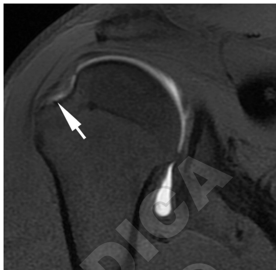
Figure 4.—SE-T1-weighted MR arthroscopic image with fat signal suppression evidencing permeation by the contrast medium of the joint side of the supraspinatus tendon (arrow) due to partial lesion of the tendon.

Figura 3. — Immagine artro-RM SE-T1 pesata che evidenzia una fissurazione (freccia) all'ancoraggio del tendine del capo lungo del bicipite omerale per lesione SLAP tipo 2.