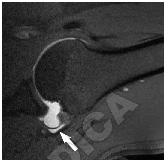
Figure 6.—VSE-T1-weighted MR arthroscopic image with fat signal suppression in ABER position showing clearly the extent of the horizontal component of a partial rupture of the joint side of the supraspinatus tendon (arrow).

Figura 5. — Immagine arthro-RM DP pesata con soppressione del segnale del grasso che evidenzia una sfumata area di segnale iperintenso riferibile ad edema osseo nel contesto del versante postero-superiore della testa omerale (freccia) che appare altresì erosa in quadro di PSI.