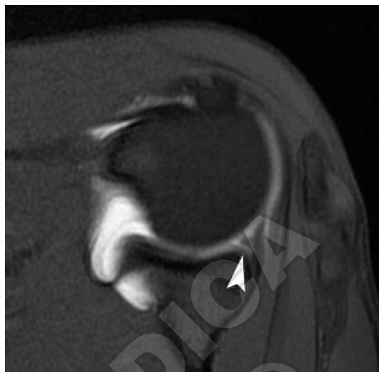
Figure 2.—SE-T1-weighted MR arthroscopic image with fat signal suppression evidencing tearing of the superior glenoid rim (arrow head). Figura 2. — Immagine artro-RM SE-T1 pesata con soppressione del segnale del grasso che evidenzia uno sfrangiamento del cerchione glenoideo superiore (testa di freccia).

Gleno-humeral microtraumatic instability (AIOS) appears to originate in chronic traumatism of the capsular structures in throwers and athletes who practice overhead sports such as tennis players, water polo players and volleyball players. The literature contains a number of theories that endeavour to explain how such overhead activities lead to the development of an AIOS. Townley 2 was the first to note that this type of microinstability may be correlated to a dysfunction of the middle gleno-humeral ligament (MGHL) and hypothesised its role as the same as that performed by the inferior gleno-humeral ligament (IGHL) in post-traumatic recurrent instability (TUBS). Andrews et al. 14 have shown that overhead athletes who have excessive external rotation and a reduction in internal rotation develop lesions at the antero-superior rim even in the absence of clear capsulo-labral detachment. According to Harryman 15 posterior capsular retraction leads to a dynamic shift upwards of the humeral head with consequent secondary impingement. Jobe 11 has hypothesised that a recurrent abduction/external rotation movement (such as baseball players perform) or elevation/abduction and internal rotation (like swimmers) with excessive anterior angulation of the humeral head with respect to the glenoscapular plane leads to spraining and micro-