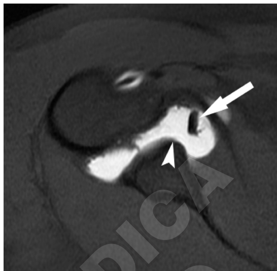
Figure 7.—SE-T1-weighted MR arthroscopic image with fat signal suppression evidencing the absence of the anterosuperior glenoid rim (arrow head) associated with a cord-like appearance of the MGHL (arrow) in a Buford complex picture.

MR in ABER (ABduction and External Rotation) position usually evidences much more clearly the horizontal component of a partial lesion of the rotator cuff (Figure 6) and a fissuration of the superior labrum, and in some cases it could even reveal an interposition of the supraspinatus tendon folded between glenoid and trochitis. 21 Moreover, the ABER position is useful for demonstrating a subluxation of the humeral head (posterior shift of the humeral axis with respect to the center of the glenoid) and anomalies of the anterior capsule. 22 The anterior band of the inferior gleno-humeral liga-