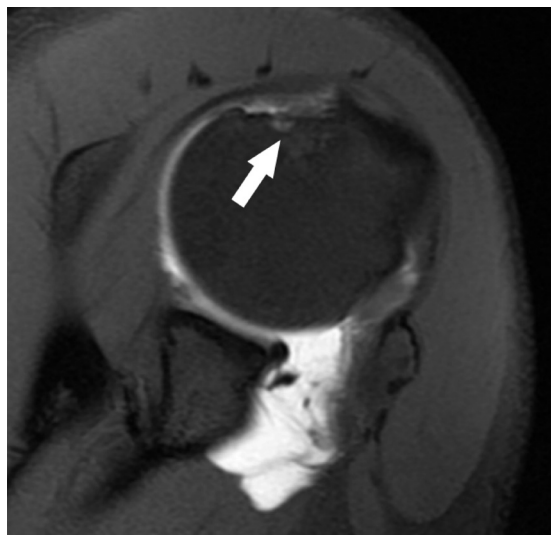
Figure 5.—DP T1-weighted MR arthroscopic image with fat signal suppression evidencing a blurred hyperintense signal area relating to bone oedema in the context of the posterosuperior side of the humeral head (arrow) which also appears to be eroded in a picture of PSI.

Figura 5. — Immagine arthro-RM DP pesata con soppressione del segnale del grasso che evidenzia una sfumata area di segnale iperintenso riferibile ad edema osseo nel contesto del versante postero-superiore della testa omerale (freccia) che appare altresì erosa in quadro di PSI.